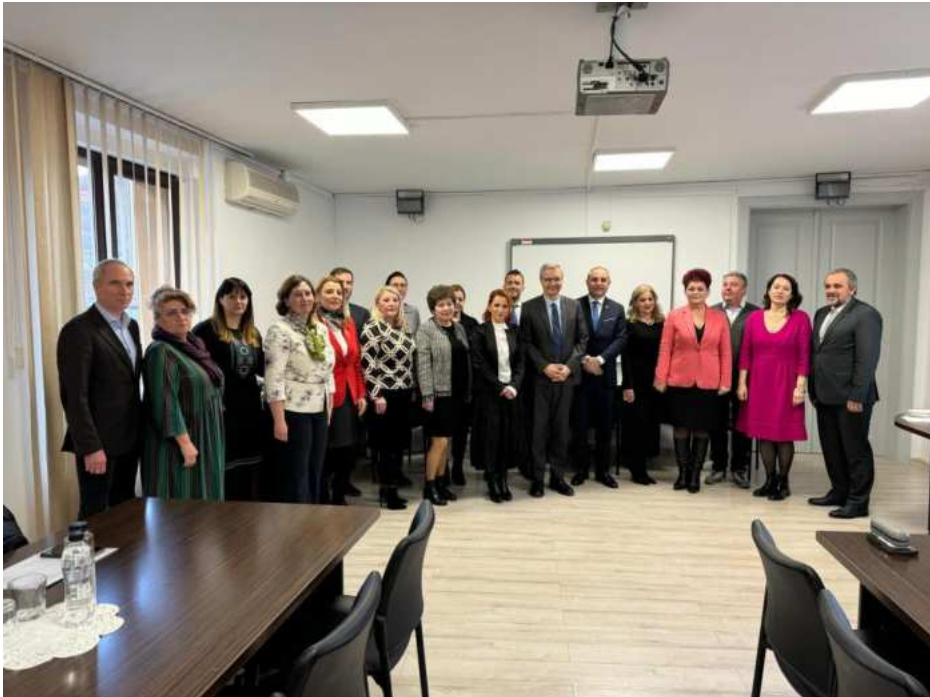
Dezvelirea plăcii Label FrancEducation la C.N. Unirea.

Întâlnire cu conducerea Inspectoratului Județean Școlar Brașov, cu directorii liceelor și cu profesori de la filiera bilingvă francofonă.